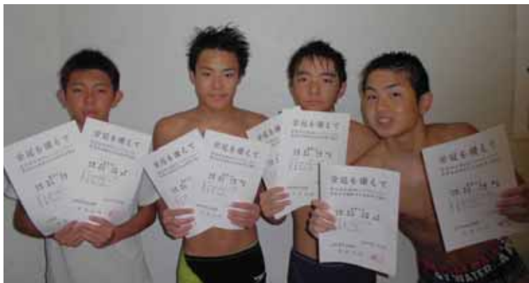
↑400mトレイラー 優勝↑ 400mフリー 優勝